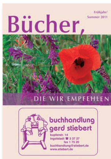
A6 mit Firmeneindruck