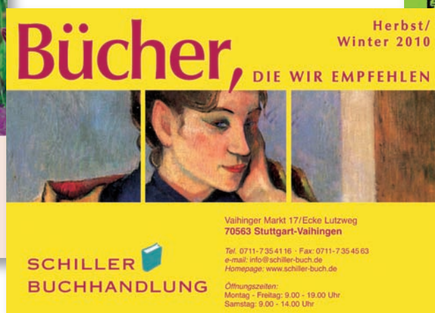
A5 Katalog mit Firmeneindruck